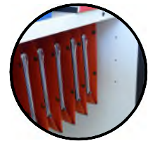
Étagère pour dossiers suspendus en option