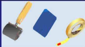
Rouleau applicateur 3M (Ref 04018) Raclette 3M (Ref PA125) Ruban de masquage 3M (Ref 1103)