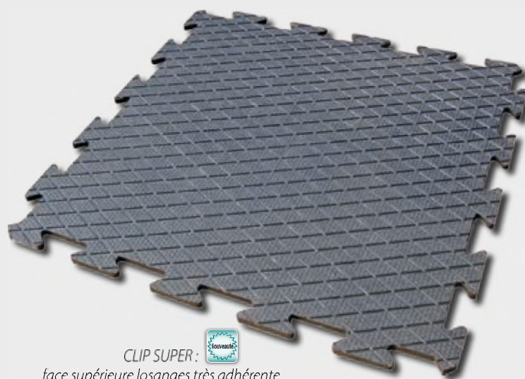
CLIP SUPER : face supérieure losanges très adhérente